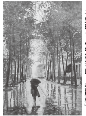
平野明さんの鉛筆画「美麗樹」